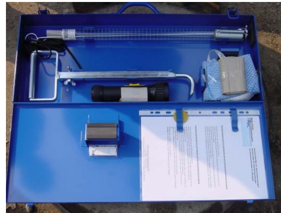
Wartungskoffer für Abscheideranlagen mit Maßband für die Schlammdeckenmessung, Ölspiegelmeßgerät und Schachthaken.

Als verantwortlicher Greenkeeper einer Anlage kann man nach einer absolvierten Schulung den Sachkundenachweis zur monatlichen Eigenkontrolle erwerben. Die Maßnahmen der Eigenkontrollen sind in der nachfolgenden Checkliste beschrieben.