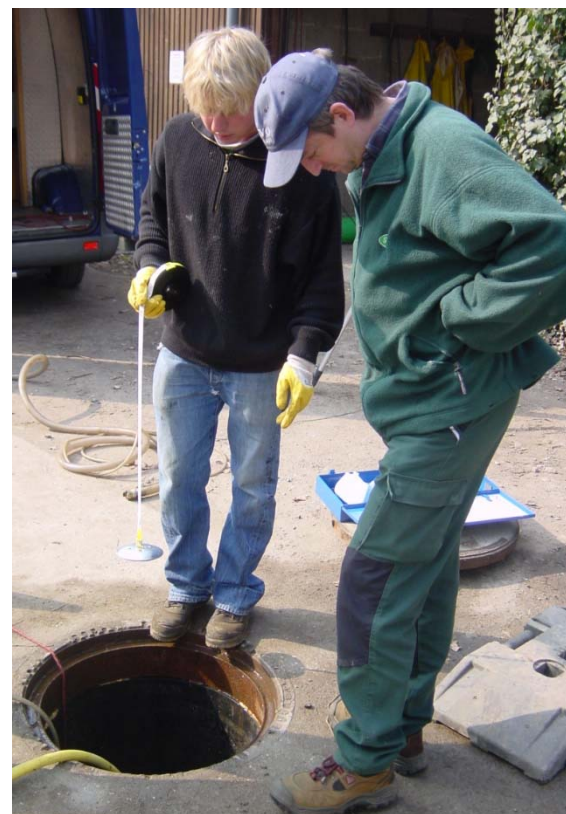
Dichtigkeitsprüfung und Schlammdeckenmessung im Rahmen der Einweisung zur Eigenkontrolle