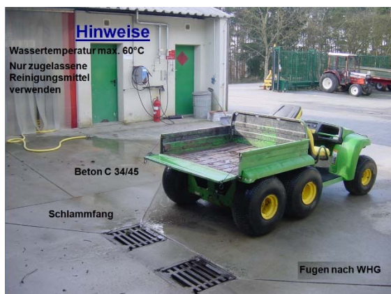
Beispiel einer Waschplatzfläche

Ein Wasch- und Betankungsplatz ist aus Beton mit klar definierten Güteanforderungen an den Beton sowie das Fugenmaterial für Rand-, Dehn- und Anschlussfugen herzustellen. Die Ausführung darf nicht in Eigenleistung, sondern nur von Fachbetrieben nach den anerkannten Regeln der Technik gemäß Wasserhaushaltsgesetz (WHG) ausgeführt werden. Die Randeinfassungen sind so herzustellen, dass kein Wasser die Fläche oberirdisch verlassen kann.