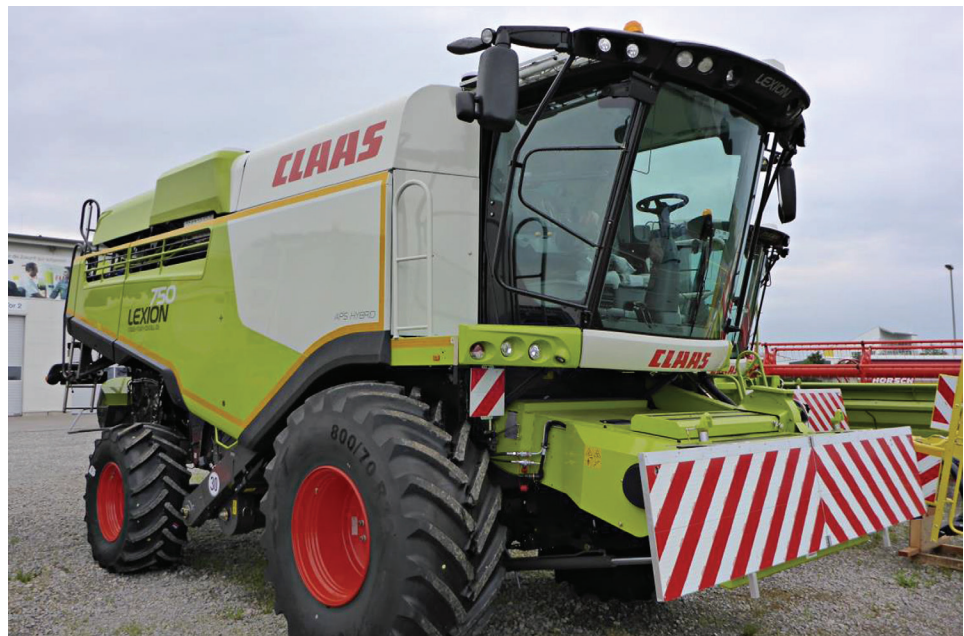
Die Radlast voll beladener Mähdrescher beträgt bis zu 12 Tonnen!

Außerdem zerstören schwere Ackergeräte die Regenwurmgänge und verdichten den Boden dabei so, dass Regenwürmer immer schwerer und durch den Unterboden oft gar nicht mehr durchkommen, trotz ihrer genialen Fress- und Pumptechnik beim Graben. Lehmitz et al. (2016) 2 betonen: „Bodenverdichtung reduziert nachweislich die Grabaktivität von Regenwürmern.“ Und Ehrmann (2015) 4 schreibt: „Ein stark verdichteter Unterboden wird daher selbst bei einer hohen Regenwurmpopulation sehr lange (vermutlich >100 Jahre) in den meisten Bereichen verdichtet bleiben“, weil die Würmer nur sehr spärlich wieder darein eindringen. In Baden-Württemberg zeigen 1/3 aller untersuchten Unterböden (nicht nur Ackerböden) keinerlei Spuren von Regenwurmmaktivität (mehr), ein weiteres Drittel nur (noch) sehr geringe.