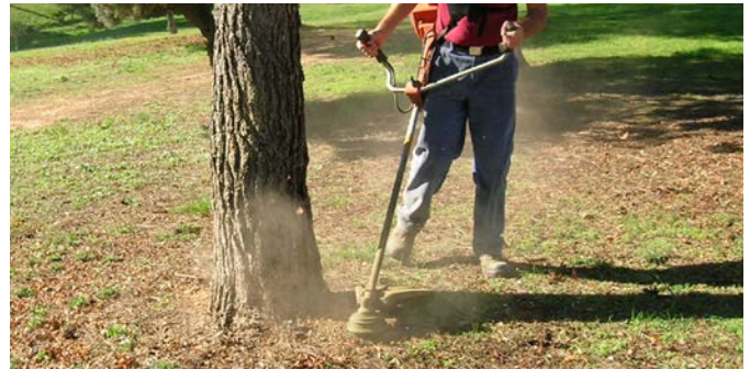
Abb. 3: Freischneider stellen eine große Gefahr für Bäume dar.

Die Verankerung des jungen Baumes mit einem Dreibock (Abbildungen 1 und 2) sollte regelmäßig kontrolliert und gegebenenfalls ausgebessert werden. Nach zwei Jahren kann der Dreibock entfernt werden, denn zu diesem Zeitpunkt wird sich der Jungbaum ent-