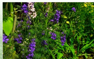
Abb. 10: Einjähriger Rittersporn mit blauen und rosafarbenen Blüten für Baumscheiben als Schutz vor Freischneidern.

Es ist einen Versuch wert, die Baumscheiben älterer Bäume mit Einjährigen zu verzieren, zumal diese eine optische Barriere für Rasenmäher und Freischneider sein könnten und so die Baumstämme vor Beschädigungen schützen.