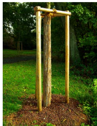
Abb. 2: Jungbaum mit Schilfmatte zum Schutz des Stämmchens und frisch angelegter Baumscheibe mit mineralischem Substrat.