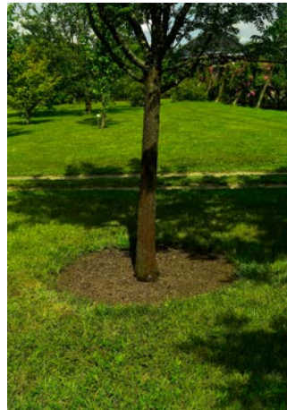
Abb. 7: Ältere Bäume mit weiterhin frei gehaltenen Baumscheiben.