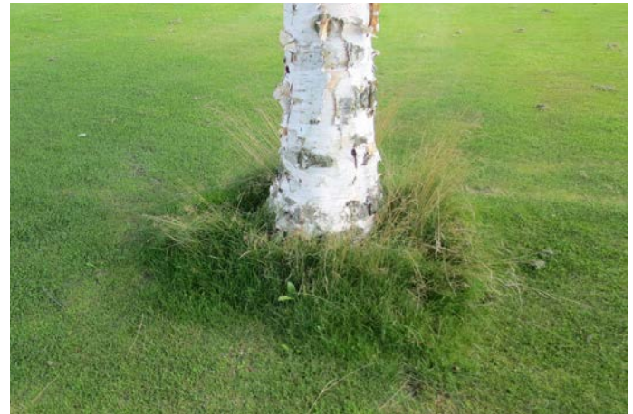
Abb. 8: Auch wenn es für manchen Golfer „ungepflegt“ erscheinen mag, Baumscheiben mit höherem Gras schützen die Bäume und sparen nebenbei auch Arbeitszeit für andere Tätigkeiten.

Eine Alternative ist es, die Baumscheibe mit Einjährigen, die im Frühjahr ausgesät werden, zu bedecken. Folgende, schön blühende Arten können verwendet werden: