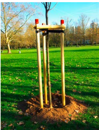
Abb. 1: Neu gepflanzter Hochstamm mit Dreibock zur Stabilisierung und Gießbrand zur besseren Versorgung mit Wasser in der Anwachsphase.

Nun gibt es unterschiedliche Methoden, um die Beschädigung der Stämme zu verhindern. Bei älteren Bäumen werden weiterhin die Baumscheiben freigehalten (Abbildung 7) oder es können Gräser und andere Wildpflanzen um den Stamm herum nicht gemäht werden. Sie bilden dann zumindest optisch eine Barriere (Abbildungen 8 und 9).