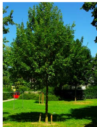
Abb. 4: Junge Linde nach mehreren Jahren mit eingekürztem Dreibock, um das Anfahren der Rasenmäher zu verhindern.