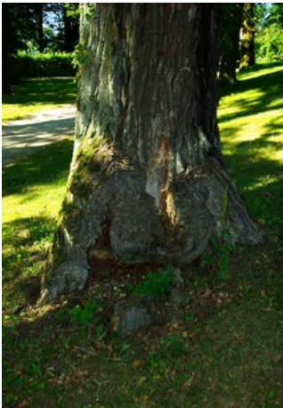
Abb. 6: Tiefreichende Faulstelle am Stammfuß, die wahrscheinlich durch eine Beschädigung im Jugendstadium entstand.