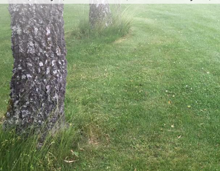
Abb. 9: Höhere Gräser als optische Barriere gegen Mäher und Freischneider – ideal mit max. zwei Mahen pro Jahr.

Die Blüten der genannten Arten werden gern von Insekten besucht, das Büschelschön gilt sogar als Bienenfutterpflanze. Die Gelbe Lupine gehört in den Verwandtschaftskreis der Hülsenfrüchtler, die mit Hilfe von Knöllchenbakterien in sogenannten Rhizobien an ihren Wurzeln den Luftstickstoff binden und dadurch für eine Stickstoffdüngung des Bodens sorgen.